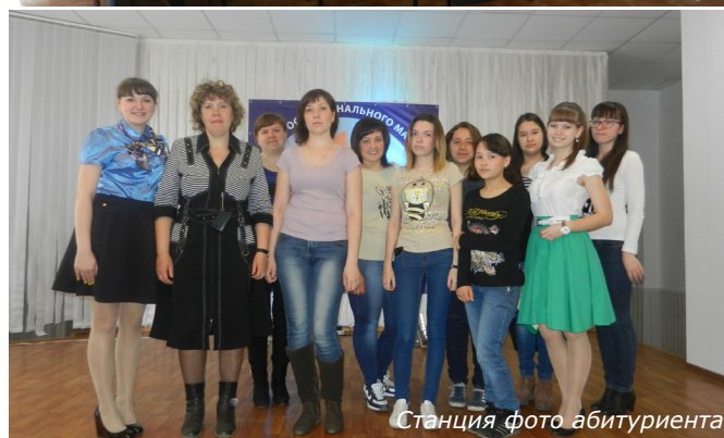
Станция фото абитуриента