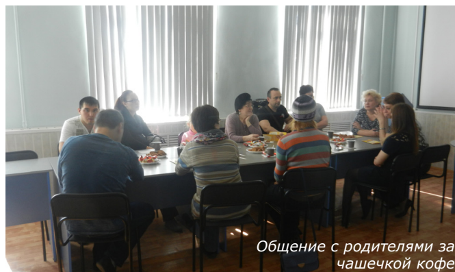
Общение с родителями за чашечкой кофе