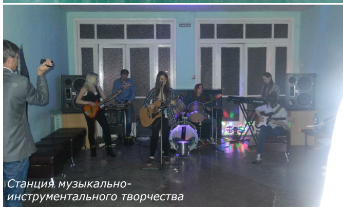
Станция музыкально-инструментального творчества