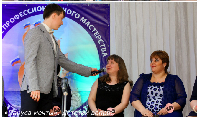
«Паруса мечты». Детский вопрос