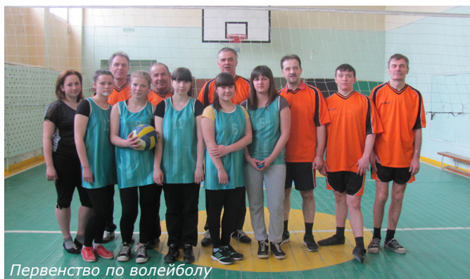
Первенство по волейболу