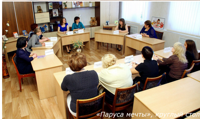
«Паруса мечты», круглый стол