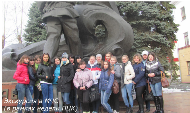
Экскурсия в МЧС (в рамках недели ПЦК)